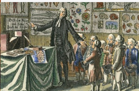
Zpracovali redaktoři, týmová práce